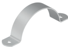
290.4 - Extra licht model RVS