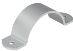
290.3 - Licht model RVS