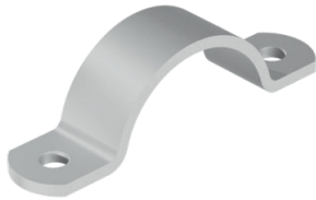
290.0 - Basis model staal / RVS