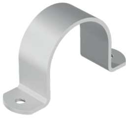
298.0 - Basis model staal / RVS