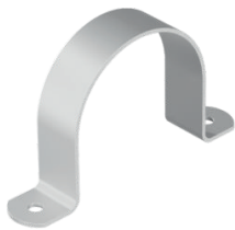
298.4 - Extra licht model RVS