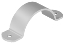
290.3 - Licht model RVS