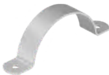
290.4 - Extra licht model RVS