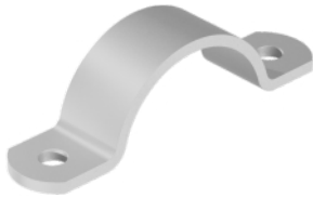
290.0 - Basis model staal / RVS